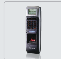
BioLite Net (version1 FW)