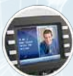
Foto-ID (Pantalla 3.5" TFT)