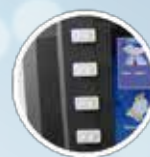
Botones de función