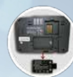
Batería de respaldo (opcional)