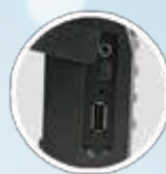
Puerto USB y salida para parlante externo